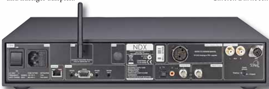
Neben den obligatorischen Netzwerk-Ein- (links) und Audio-Ausgängen (rechts) bietet der NDX auch drei Digitalanschlüsse (Mitte unten) und einen Stromanschluss für das externe Netzteil XPS (darüber)