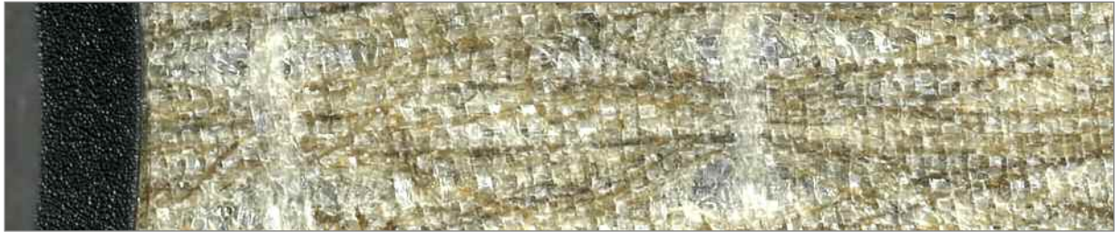
Der Mitteltöner besteht aus einem Flachs-Gewebe, das vorne und hinten mit einer Glasfaserschicht stabilisiert wird