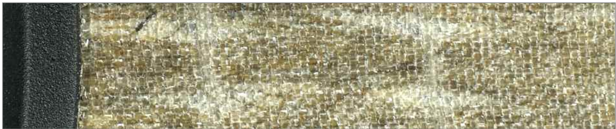
Dichter gewebt, um der mechanischen Belastung durch den größeren Hub gewachsen zu sein: die Membran der Basstreiber

DIN-Buchsen und der Vorliebe für externe Netzteile. Aber klanglich passen beide wirklich gut zusammen. Das bestätigen mir auch viele Kunden, die nach ausgiebigem Hören gerne eine Aria 926 oder Aria 936 von Focal mit einem Vollverstärker oder einer kleinen Vor-/Endstufenkombination von Naim kombinieren. So etwas habe ich jetzt für eure Leser zusammengestellt.“