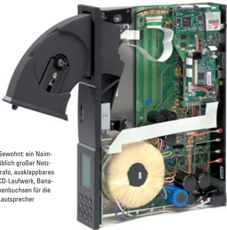
Gewohnt: ein Naim-üblich großer Netztrafo, ausklappbares CD-Laufwerk, Bananenbuchsen für die Lautsprecher