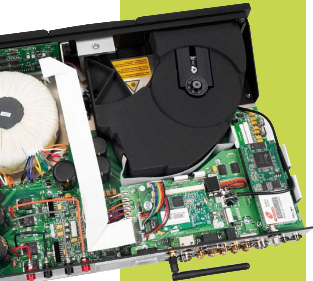
Aufgeräumt: Das Innenleben des Uniti lässt sich wie eine Stahl-Schublade aus dem Alu-Gehäuse ziehen. Jeder Zentimeter wird genutzt. Links oben neben dem CD-Laufwerk der massive Ringkern-Transformator.

Handbetrieb: Ein Zug am Knebelgriff öffnet die CD-Schublade. Sie befördert das Philips-Laufwerk in sanftem Bogen aus dem Gehäuse – ein typisches Erkennungsmerkmal der CD-Player aus Salisbury.