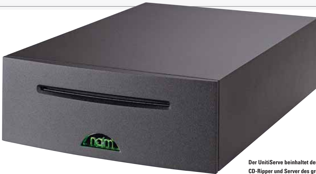
Der UnitiServe beinhaltet den exzellenten CD-Ripper und Server des großen Naim HDX

Zwei mal dreißig Watt sind keine ideale Basis für einen vorlauten Auftritt. Das könnte man zumindest annehmen. Doch Naims kleiner UnitiQute legt trotz seiner überschaubaren Leistungsreserven derart teuflisch los, als sei selbiger hinter ihm her. Da erwischten wir uns während der Hörsessions immer wieder mit vor Staunen offenem Mund. Und den bekommt man auch dann nicht zu, wenn man sich auf dem Produkt-Datenblatt zum x-ten Mal versichern will, ob da nicht doch irgendwo noch eine andere Leistungsangabe versteckt ist. Ehe man die Wattzahlen findet, muss man sich nämlich durch etwa eine DIN-A4-Seite mit Ausstattungsmerkmalen arbeiten, die sich lesen wie das Who's Who der „neuen Medien“.